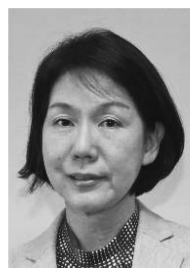
松村教育長 職務代行者