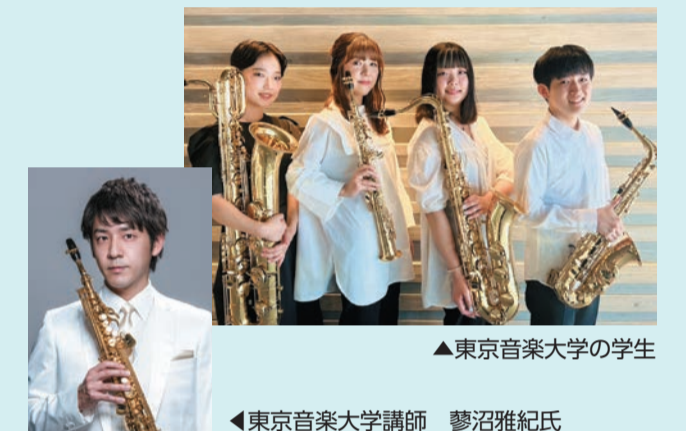
▲東京音楽大学の学生

時 11月19日(日) 11:00開演(10:30開場) 曲目 モーツァルト「トリビュート」ほか