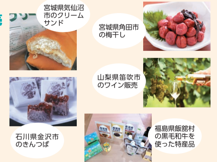
宮城県気仙沼市のクリームサンド