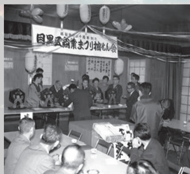
▲昭和37年は商業まつりとして開催

目黒区商工まつりは、「優良生産品展示会」という名称で、昭和32年に開催されたのが始まりです。区内で商工業を営む事業者たちが、自分たちで生産・商売している製品やサービスをたくさんの区民に知ってもらい、企業として地域社会に貢献する姿勢をPRすることが目的でした。