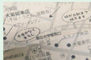
▲マップには、「歩道がなく車多し」「トイレのある公園」といった、パパ・ママ目線の一言が添えられている

紙のマップを配布することにも、意味がある。「近くの児童館にマップをもらいに行くことで、お出掛けするきっかけが生まれ、孤独になりがちなパパ・ママを応援する形につながればと思っています。でも、最初はいろいろな施設にマップを置いてもらうことに、とても苦労しました」。マップ作り隊を知ってもらうために、方々を回り説明したという。「今では壁に貼って、次はどこへ行こうかと考えるのが楽しみとか、マップに掲載している誰でもトイレが、高齢者や障害があるかたにも喜ばれていると聞き、とてもうれしく思っています」。