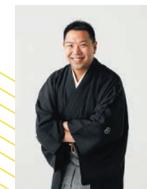
▲卒業生は八雲小学校の