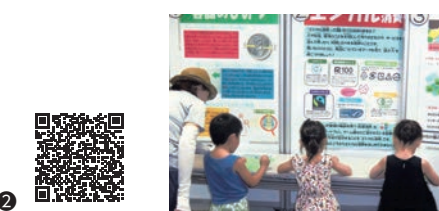
▲過去に開催したパネルクイズの様子