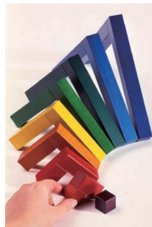
▲目黒区美術館所蔵のトイ「アンゲーラ」