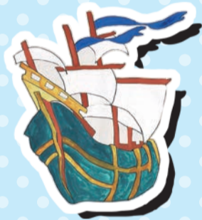
▲子どもたちが描いたアドベンチャークルー号

当児童館の特徴は、クラブ室(学習室)や雑誌コーナーのある青少年プラザ(4階)や、1万5千冊の書籍をそろえる男女平等・共同参画センター(8階)が同じビル内にあること。クラブ室で宿題を頑張った後に友達とバスケットボール、親子で遊びに来たついでに、8階で本を借りるなんてこともできます。工作や子ども会議などのイベントも定期的で開催しています。小学生はもちろん、乳幼児の親子や中学・高校生も、ぜひ遊びに来てください。