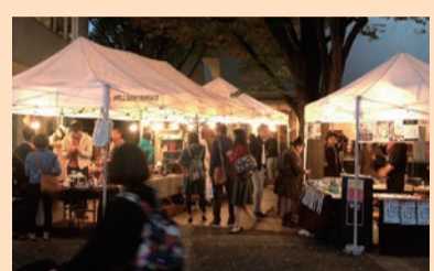
▲MISCイベント「インテリアコレクション」。ここにしかない一品を探しに多くの人が集まった

その後、雑誌によるイベントがなくなってしまったため、自分たちで地域活性化につなげようと、目黒通りのインテリアショップのオーナーたちでMISC(目黒インテリアショップコミュニティ)を立ち上げました。マップを作ったり、イベントを開催したりして、地域を盛り上げてきました。東日本大震災の折には、目黒区の友好都市である宮城県気仙沼市の気仙沼復興協会と連携し、オリジナル製品を開発。売り上げを寄付し、復興支援活動も行ってきました。現在、MISCは活動を終えてしまいましたが、今でもショップ同士のつながりは健在です。