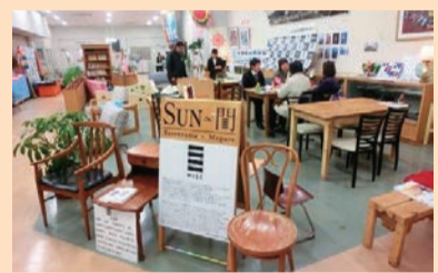
▲東日本大震災翌年の平成24年に、気仙沼復興協会と協力して気仙沼市役所内に設置した休息スペース