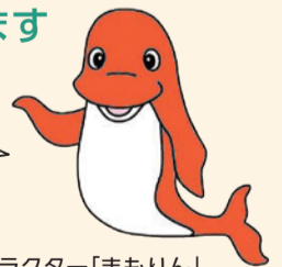
見守りめぐねっとキャラクター「まもりん」