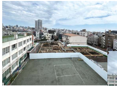
向原小学校 (屋上からの学校敷地の様子)

令和5年12月から仮設校舎の建設工事を行っており、令和6年7月に完成。9月からは仮設校舎で授業を行う予定です。その後、既存校舎の解体、新校舎の建設を行っていきます。