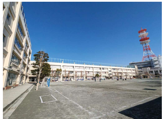
鷹番小学校(現在の校舎と校庭)

鷹番小学校の建て替えに向けて基本構想の策定に取り組んでいます。鷹番小学校の建て替えに当たっては、学校に関わる多くの方々との意見交換や情報共有を行っていくため、学校・保護者・地域で構成される「目黒区立鷹番小学校新校舎検討地域懇談会」を設置し、学校の建て替えや区有施設との複合化・多機能化等について話し合いを進めます。基本構想は令和7年2月頃に決定する予定です。基本構想がまとまり次第、基本設計の策定に取り組んでいきます。