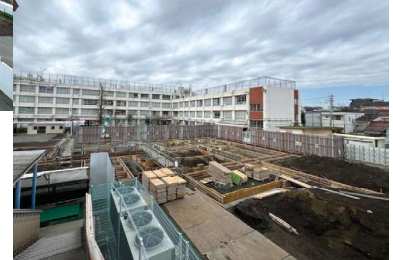
向原小学校(仮設校舎建設中)

向原小学校の建て替えについての詳細は、区公式ウェブサイト(右コード)をご覧ください。