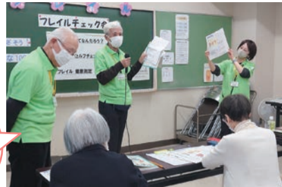
▲▼フレイルチェック会