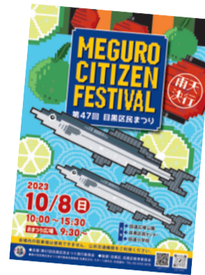
▲5年のポスターデザイン