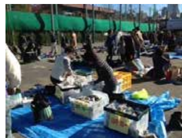
<フリーマーケット>

2013(平成25)年度は、フリーマーケット、ガレージセールを行い、延べ600人以上が来場しました。