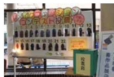
<リフォームファッションコンテスト>

環境に配慮した生活を提案するため、身近な体験を通して楽しく学べる、さまざまなテーマの講座・講習会を目黒及び平町のエコプラザにて開催しました。2013(平成25)年度に開催した講座・講習会は全56講座、延べ1,621人の参加がありました。