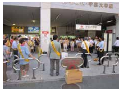
<ポイ捨て禁止キャンペーン>

区では、環境美化推進団体にトングやガム取り棒などの用具の貸出しや啓発品の提供、さらに落書きの消去剤の貸出しを3件行いました。現在33団体が活動しています。さらに、路上喫煙禁止区域における啓発として、路上シート107枚及び立看板100枚の設置、指定喫煙所の環境改善を行いました。