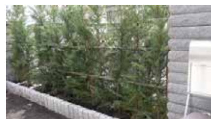
<道路沿い緑化の例>