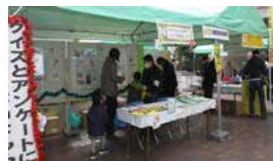
<エコまつりめぐろ2013・展示ブース>

2013（平成25）年12月にエコライフめぐろ推進協会と共催で「エコまつりめぐろ2013」を開催しました。参加団体数は44団体、来場者数は約4,500人でした。