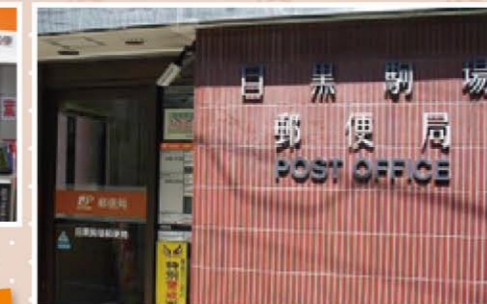
目黒駒場郵便局(駒場一丁目)