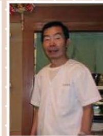
たけすし (目黒本町四丁目)