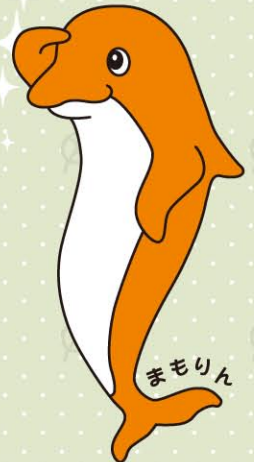
目黒区高齢者見守りネットワーク キャラクター

地域の皆さんが、高齢者の「ちょっと気がかり」 なことに気づいたときに包括支援センターへ連絡 いただくことで、高齢者をゆるやかに見守っていく取り組みです。 各地区の包括支援センターが中心となって、PRキャラクター まもりん の活躍の場を増やしていきます。 多くのかたに関心を持っていただき、いくつもの「見守りの輪」 を作っていきます。ご協力をお願いします。