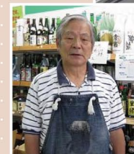
マイマート甲州屋酒店 (目黒四丁目)