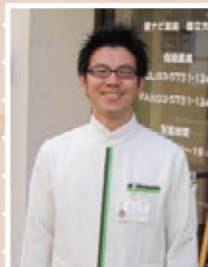
健ナビ薬局都立大学 (中根二丁目)