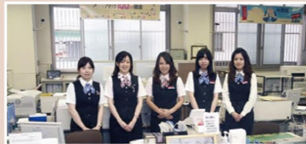
目黒信用金庫本店(中目黒三丁目)

超高齢社会を迎えても、地域のかたに安心して利用していただけるよう、 見守りめぐねっ との協力事業者として今後も努力してまいります。