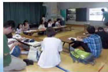
「デジカメ講習会の前半は座学、後半は中目黒スクエア近くの目黒川沿いにある中目黒公園に移動しての実践体験となりました。」