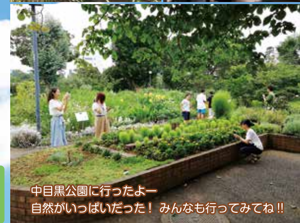
中目黒公園に行ったよー 自然がいっぱいだった! みんなも行ってみてね!!