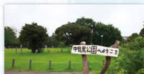
「取材の資料としても使えるように看板を入れ、構図も意識して撮影しました。(実友有)」

7月21日(日)に中目黒スクエアにて開催された、夏休み講習会①のスマホ・デジカメ撮影講座で、取材にも役立つ写真の撮り方を学びました。