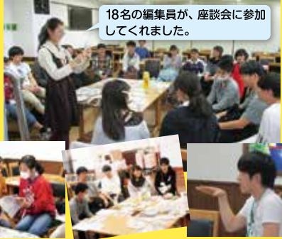
企画・運営：磯崇大、大坪琴里、菅野にこ