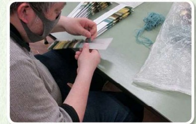
毛糸サンプル台帳