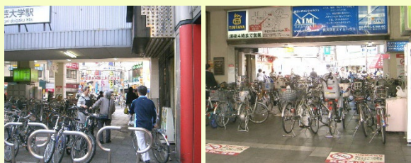
昔(平成 19(2007)年)の駅コンコース入口(15 年前)