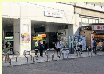
今(令和 4(2022)年)の駅コンコース入口