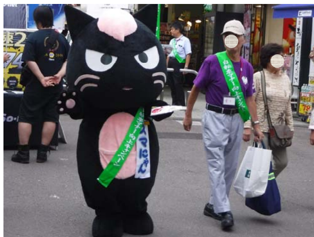
スマにゃんと参加者による呼びかけ等

大規模な押しちゃりキャンペーンでは、地域の方々も含め多くの参加者を得て、自転車利用の実態を把握しながら、駅コンコース内や東西商店街など歩行者の多いところでは、“自転車の押し歩きにご協力ください”と呼び掛ける運動などを行います。