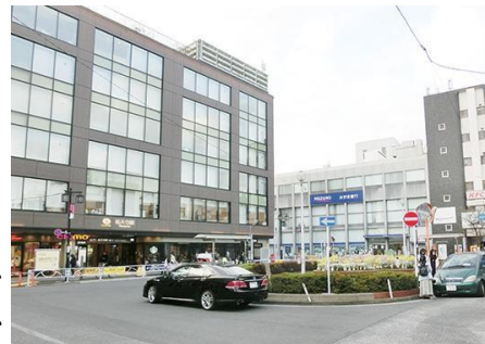
今後の基本計画を検討する祐天寺駅前のロータリーの様子

まちの課題や動きを踏まえて、区は平成30年から地域の皆さまで構成する街づくり懇談会を12回開催し、ご意見を伺いながら、「祐天寺駅周辺地区整備構想」「同整備方針」に続き、「同整備計画」※4ページ参照を取りまとめました。今年度から、下表のように地域主体の“まち”づくりを進めていきます。懇談会とワークショップを開催しますので、ぜひご参加ください。