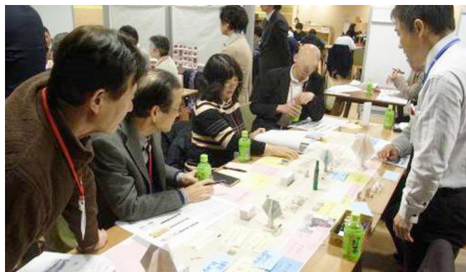
ワークショップのイメージ

このうち駅前広場の再整備については、ワークショップを実施し、将来の利活用についての想定もしながら具体的な検討を行っていきます。