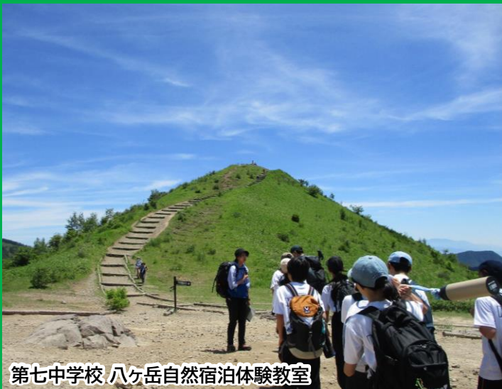
第七中学校 八ヶ岳自然宿泊体験教室