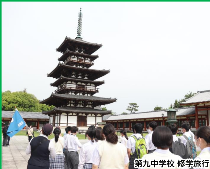
第九中学校 修学旅行