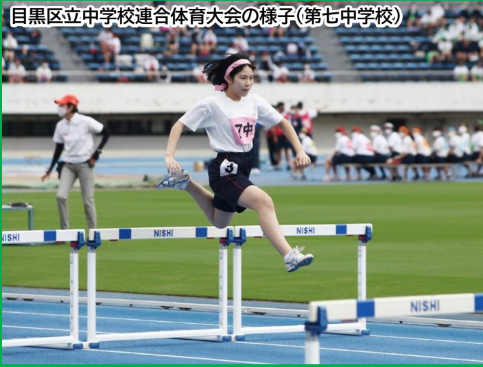
目黒区立中学校連合体育大会の様子(第七中学校)