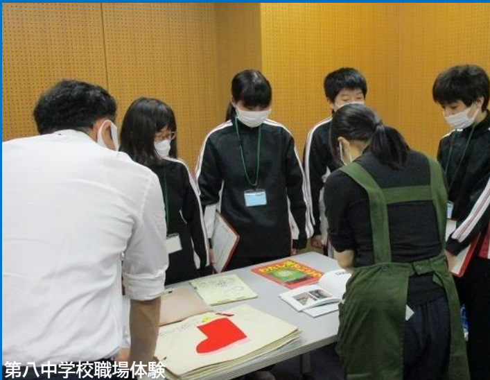
第八中学校職場体験