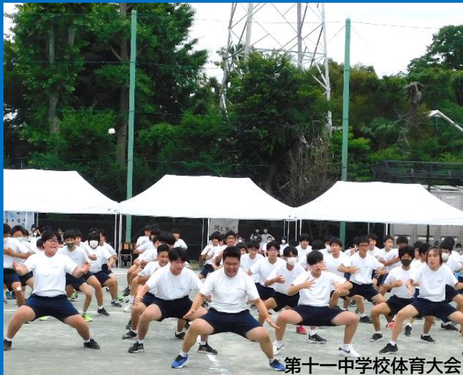
第十一中学校体育大会