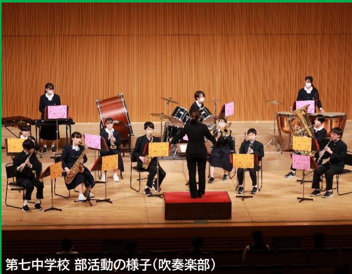
第七中学校 部活動の様子(吹奏楽部)