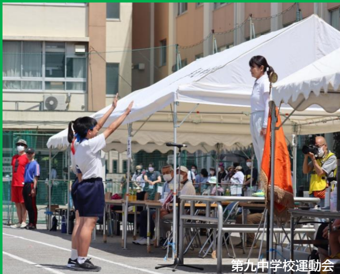
第九中学校運動会