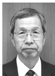
笹尾教育長 職務代行者