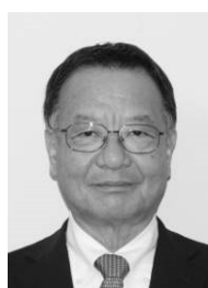
櫻井教育長 職務代行者