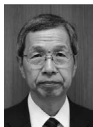
笹尾教育長 職務代行者