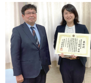
長谷校長と梶井主任教諭