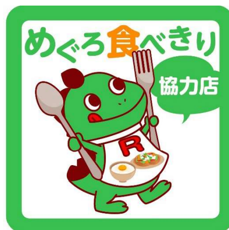
〈めぐろ買い物ルール*・食べきり協力店*のステッカー〉