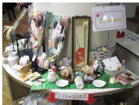
<目黒区エコプラザ*のリサイクルショップ>