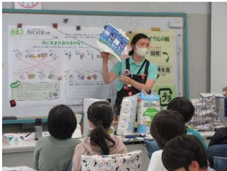
<小学校での出前講座>