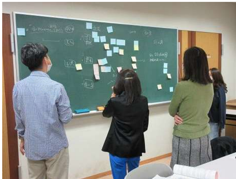
<環境推進員養成講座*グループワーク>