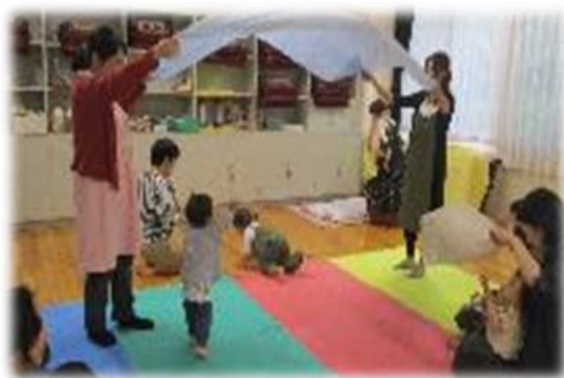
『住区センターでの遊び』

日頃、保育園で遊んでいる遊びを紹介 地域の子どもたちのふれあいの場になっています