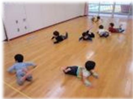
音や歌に合わせてリズム遊び