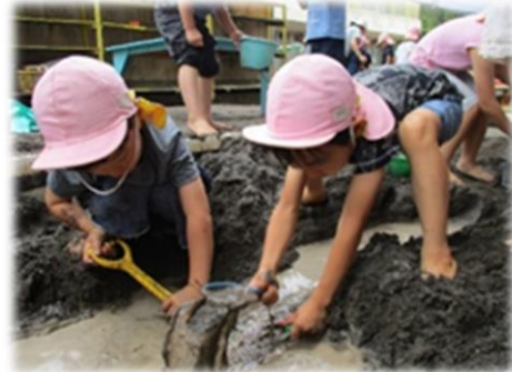
友達と協力してダムづくり