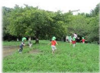
西郷山公園で四季折々の自然を感じながら のびのびと遊びます