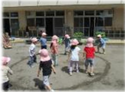
中あてドッジボール遊び