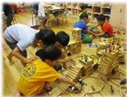
力を合わせて積み木で町づくり