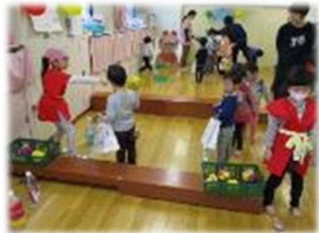
おみせやさんごっこ