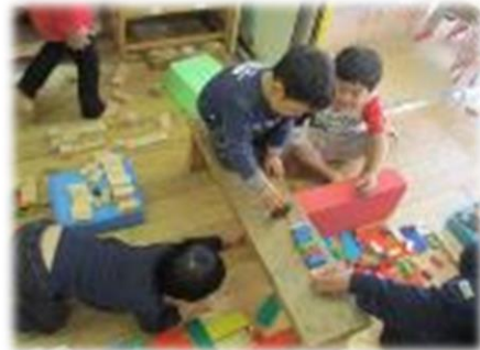
道路や駐車場を作り、自動車を動かして遊ぶ