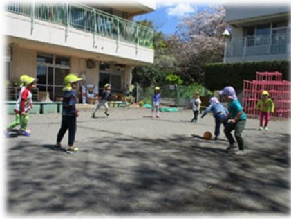
広い園庭で中あてドッジボールを 楽しんでいます