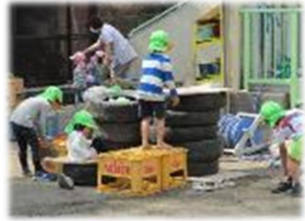
素材や形の違うものを組み合わせ 立体的なものを作り上げて遊びます