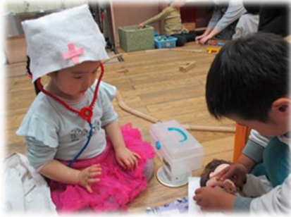
友達とやりとりをしながらお医者さんごっこ