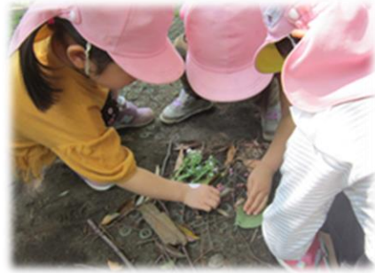
発見や不思議がいっぱい