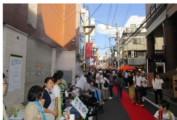
広小路ブロックパーティー2018 (自由が丘広小路会)