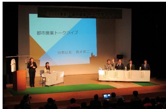
都市農業トークライブの様子