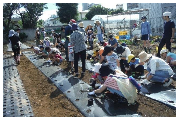
ミニ農業体験の様子