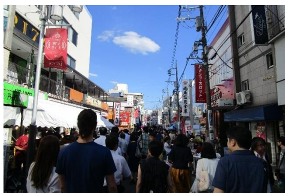
サンフェスタフェスティバル(旭会)