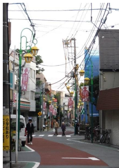
油面地藏通り商店街の風景