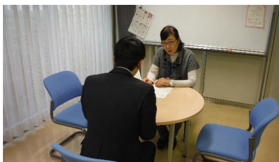
「ワークサポートめぐろ」における就労相談