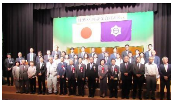
中小企業合同顕彰式