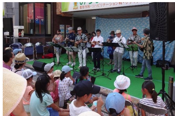
夕涼み祭り(祐天寺栄通り商店街振興組合)