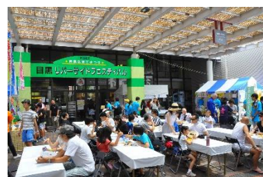
目黒区商工まつり (目黒リバーサイドフェスティバル)