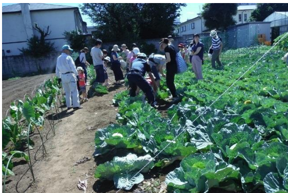
きゃべつの収穫体験

②都市農業への理解を深める取組…都市農地を保全することの重要性について周知するため、世田谷目黒農業協同組合と世田谷区との協働によるイベントや、都内の自治体で構成する都市農地保全推進自治体協議会におけるフォーラムの開催等、区民への啓発活動に努めていきます。