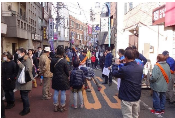
もちつき大会(池尻大橋駅前商店会)