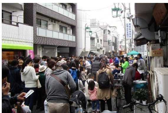
きたほんオータムフェス (大岡山北本通り商店街振興組合)