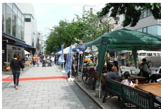
マリクレールフェスティバル(自由が丘南口商店会)