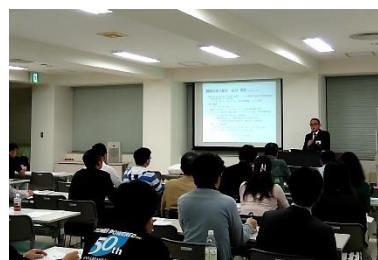
実践めぐる創業塾