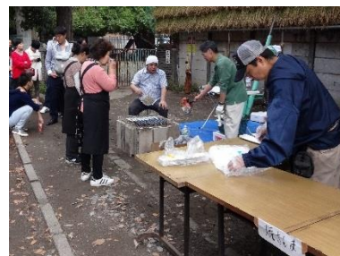
もみじまつり(祐天寺みよし通り商店会)