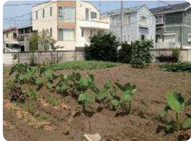
区内に残る貴重な農地（八雲）