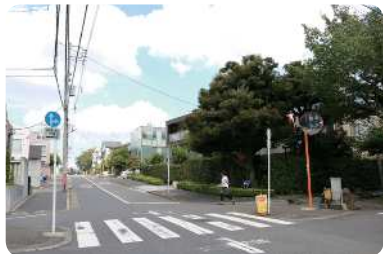
戸建住宅の多い住宅地のみどり（東根）