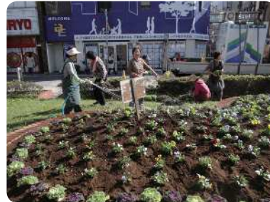
住民ボランティアにより管理されている花壇（祐天寺）