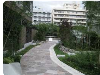
集合住宅のみどり（中目黒）