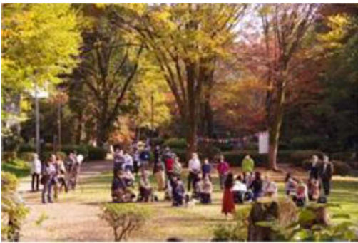
町田市（地産地 SHOW コンサート）

ライフスタイルや働き方等の価値観の多様化により、区民がより主体性を持ち、自由に社会への関わり方を選択できる時代になるにつれて、ビジネスや住宅など複合市街地の顔をもつ区民センター周辺は、目黒駅から中目黒駅エリア間の交流や賑わい創出の場としての役割が今まで以上に求められています。これらの社会潮流や地域特性を踏まえ、新たな区民センターは、これまでのように単に区がサービスを提供する場ではなく、区民が主体的にまちづくりの担い手となり、またそれぞれの活動を社会に還元し、活躍できる場となることで、区民同士の交流、つながりを支援します。