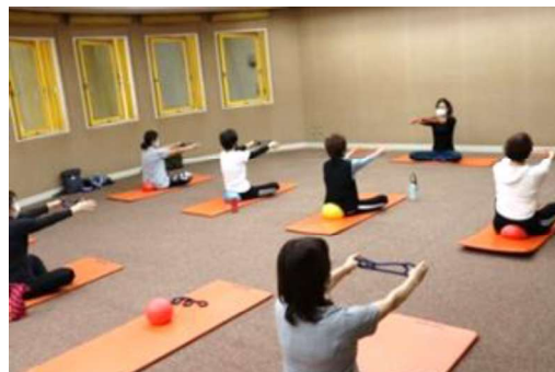
大阪市（会議室での運動教室）