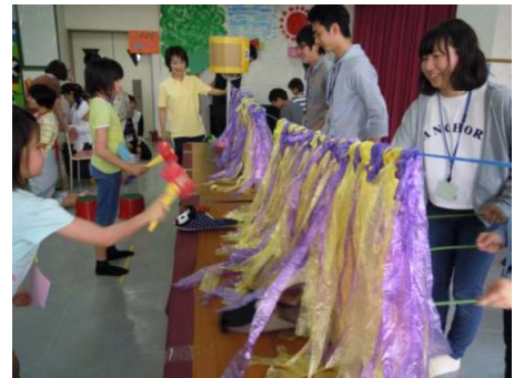
尾張旭市（まちづくり活動貢献学生認定制度）