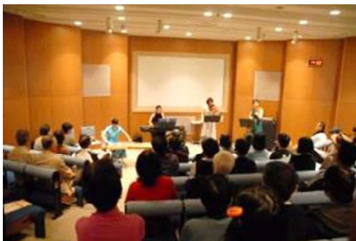
大分市美術館（美術館で音楽会）

そのような時代においても、将来の区民が利用し続けることのできる空間となるよう、新たな区民センターは用途が限定される空間、特定の用途で専用する空間は必要最小限にとどめる等、現代の発想で固めてしまうのではなく、将来に向けて多機能かつ柔軟な運用を可能とする空間を整備します。