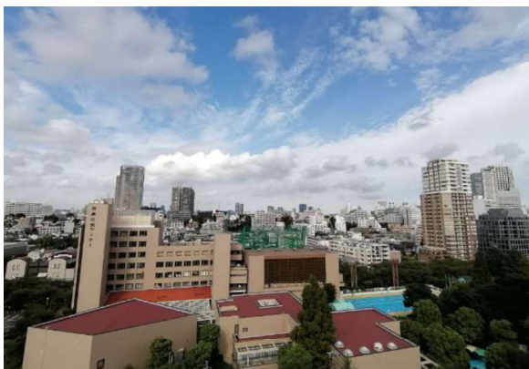
区民センターと周辺の街並み

これらの取組により区民センターが地域の有効な資産となり、周辺地域で行われる様々な分野の活動が賑わいの創出やコミュニティの形成へと発展し、周辺地域のまちづくりを広げていきます。