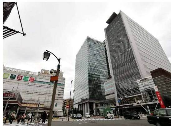
目黒駅周辺の高層ビル