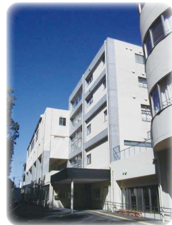
南部包括支援センター 碑文谷 1-18-14 碑小学校内南西側 ☎5724-8033