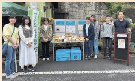
▲地域コミュニティ醸成を目的に活動する、不動産プロボノネットワークのフードドライブ