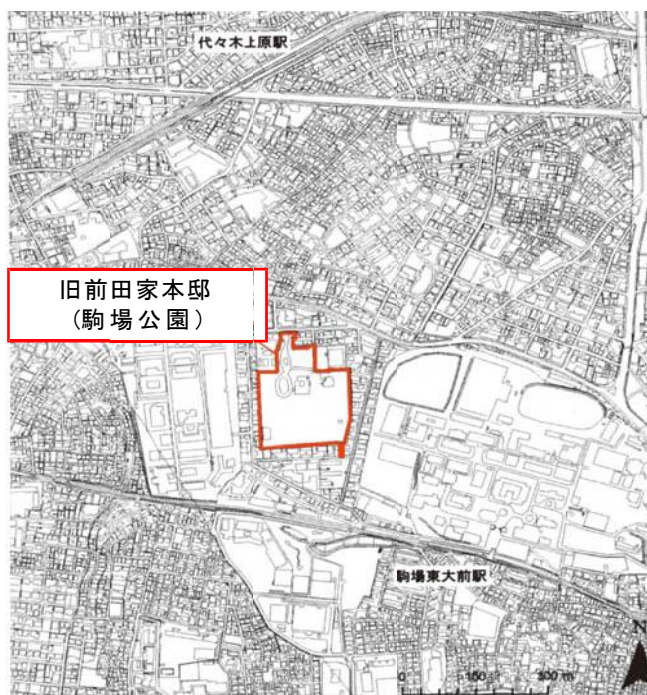
図1 旧前田家本邸位置図