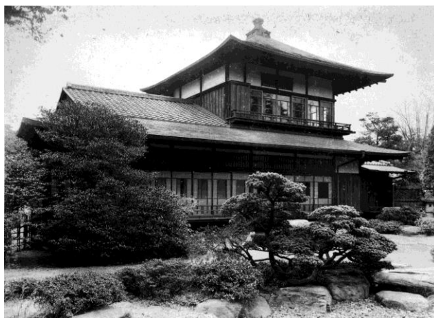
図4 駒場本邸和館