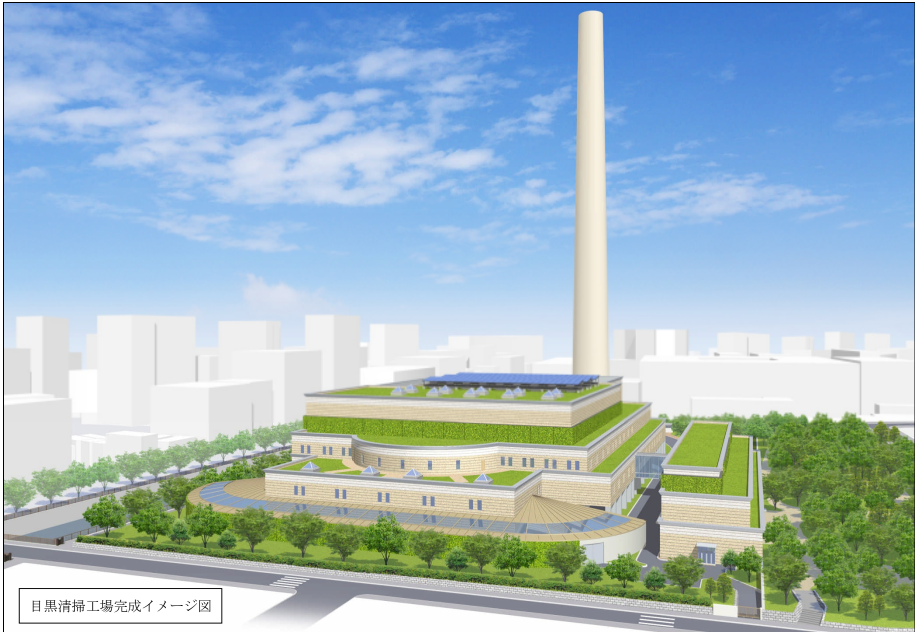
目黒清掃工場完成イメージ図