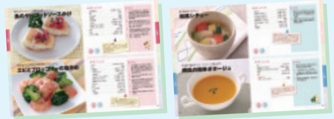
掲載レシピの一例