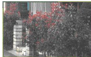
ベニカナメモチ（写真）、イヌツゲ、シラカシ、ウバメガシ、イヌマキ など