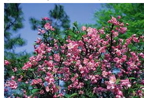
ハナカイドウ（写真）、マンサク、ソヨゴ、キンモクセイ など