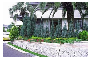
ブルーヘブン（写真）、コロラドヒヤクシン、ゴールドコーン など