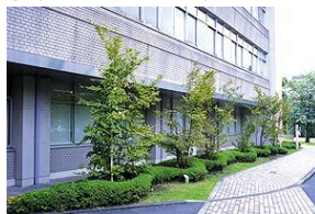
ナツバキ（写真）、ヤマモモ、シラカシ、ハナミズキ、クロガネモチ など