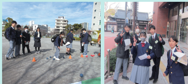
プチアドベンチャーゲームの様子

午前中は、両校の合同班によるプチアドベンチャーゲームを行いました。「指示書」のヒントと地図を頼りに、隅田公園を起点にチェックポイントを巡り、謎解きの課題を皆で相談しながら解答用紙に記入していきました。最初は、緊張した表情が多かったものの、ゴール時点には達成感にあふれた表情が多く見られました。