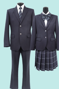
投票により決定した標準服