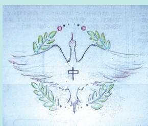
投票により決定した校章図案

今後、採用された生徒の意見を聞きながら、デザイナーにより校章を完成させていきます。