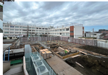
向原小学校(仮設校舎建設中)

向原小学校の建て替えについての詳細は、区公式ウェブサイト(右コード)をご覧ください。