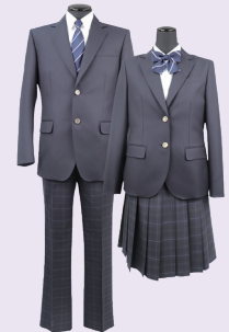
投票により決定した標準服