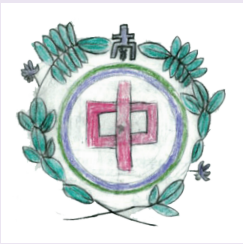
投票により決定した校章図案

今後、採用された生徒の意見を聞きながら、デザイナーにより校章を完成させていきます。