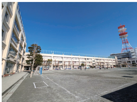
鷹番小学校(現在の校舎と校庭)