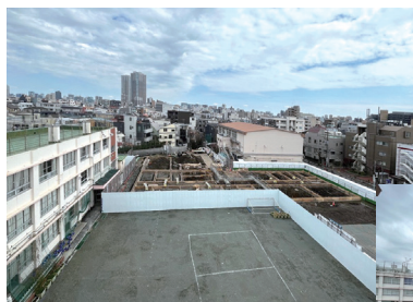
向原小学校 (屋上からの学校敷地の様子)

令和5年12月から仮設校舎の建設工事を行っており、令和6年7月に完成。9月からは仮設校舎で授業を行う予定です。その後、既存校舎の解体、新校舎の建設を行っていきます。