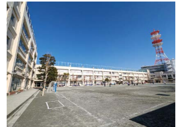
鷹番小学校(現在の校舎と校庭)