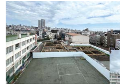
向原小学校 (屋上からの学校敷地の様子)

令和5年12月から仮設校舎の建設工事を行っており、令和6年7月に完成。9月からは仮設校舎で授業を行う予定です。その後、既存校舎の解体、新校舎の建設を行っていきます。