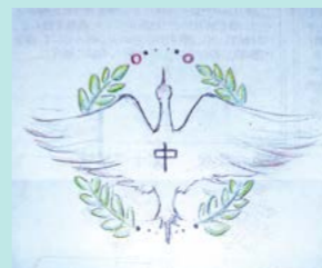
投票により決定した校章図案

今後、採用された生徒の意見を聞きながら、デザイナーにより校章を完成させていきます。