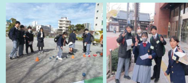
プチアドベンチャーゲームの様子

午前中は、両校の合同班によるプチアドベンチャーゲームを行いました。「指示書」のヒントと地図を頼りに、隅田公園を起点にチェックポイントを巡り、謎解きの課題を皆で相談しながら解答用紙に記入していきました。最初は、緊張した表情が多かったものの、ゴール時点には達成感にあふれた表情が多く見られました。