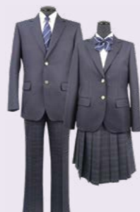
投票により決定した標準服