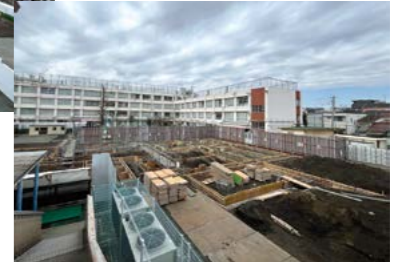
向原小学校(仮設校舎建設中)