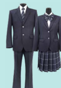
投票により決定した標準服