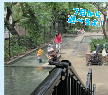
▲ 三田丘の上公園(三田1-4-6)