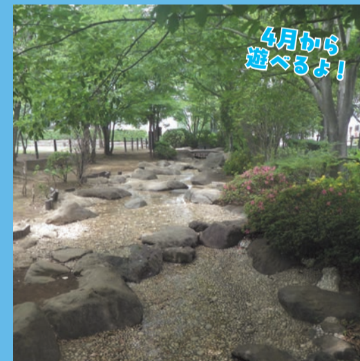
▲ 区民キャンパス公園(八雲1-1-12)

じゃぶじゃぶ池や小川など、区内には水遊びができる公園がたくさんあります。区民キャンパス公園以外(下記参照)は、7~9月に遊ぶことができます。