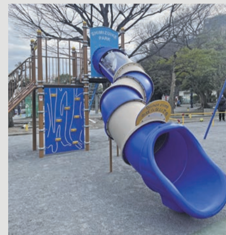
▲ 清水池公園(目黒本町2-12-10)