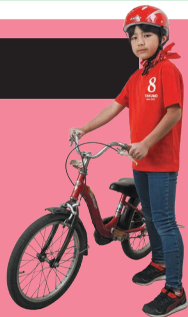
◀ 衾町公園児童交通施設(八雲5-2-10)

公園内で使える自転車や三輪車を借りることができるので、自転車の練習におすすめです。また、手こぎボートに乗ることができる公園は、池の魚や水鳥に出会える楽しみもあります。