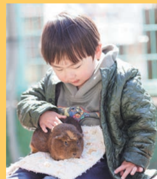
◀ 碑文谷公園こども動物広場(碑文谷6-9-11)