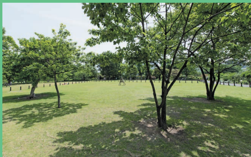
▲中目黒公園(中目黒2-3-14)

風を感じながらのんびりしたり、ピクニックをしたり、子どもも大人も楽しめる広い草のある公園があります。軟らかい土と草の上なら転んでもあまり痛くないので、歩き始めの子どもにもおすすめです。