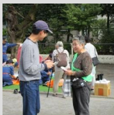
☆ 10月20日 大岡山フェスタ