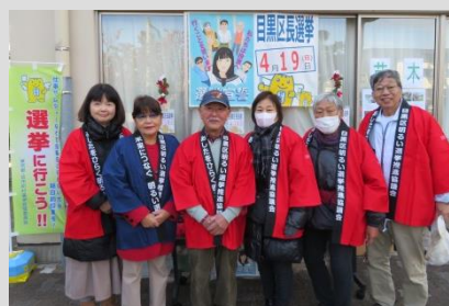
☆ 12月1日 碑文谷ふれあい広場