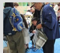
☆ 11月3日 向原住区まつり