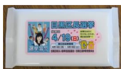
ウェット ティッシュ