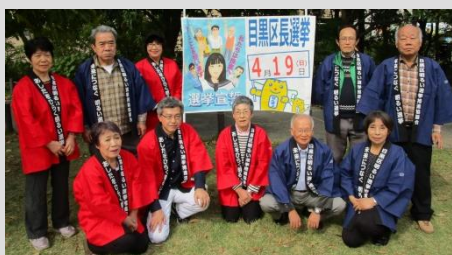
☆ 10月27日 中目黒公園祭