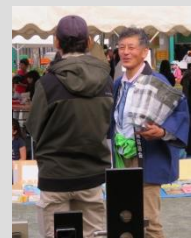
☆ 10月27日 おまつり広場・みどり