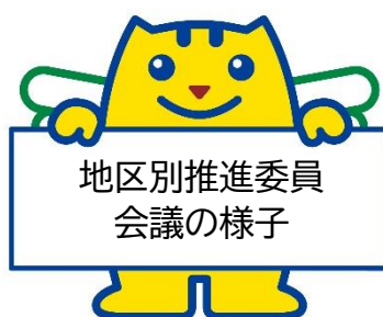
地区別推進委員 会議の様子