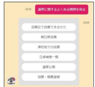
▲LINEで質問にお答えしました