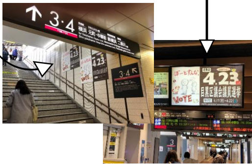
▲駅構内やモニターに！