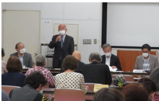
▲明るい選挙推進協議会会長のあいさつ

全体会の後半では、各地区に分かれ、地区別推進委員会議を行いました。その中で、日ごろの啓発活動での気づきや、学校での主権者教育の重要性などについて、活発な意見交換が行われていました。また、4月に行われた区議会議員選挙についての意見・情報交換も行われました。