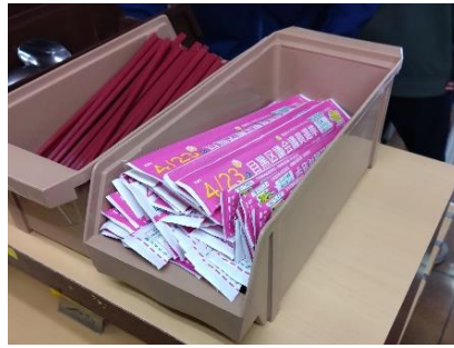
▲区内大学のほか区役所売店でも配布