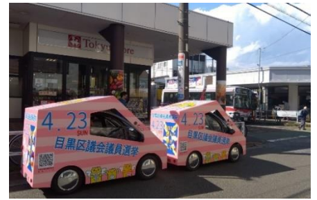
▲区内各地を走り回っていました！