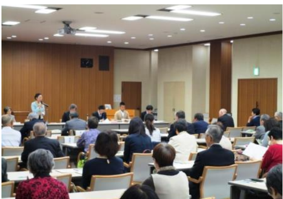
▲ 多くの委員のかたが出席されました

事務局からは、啓発活動について、平成29年度の実績報告と平成30年度の事業計画の説明を行いました。その後、地区ごとに分かれて顔合わせ会に移り、地区代表の明るい選挙推進協議会委員が選出されました。顔合わせ会の懇談では、啓発品のアイデアや配布方法の工夫など、活発な意見交換が行われていました。