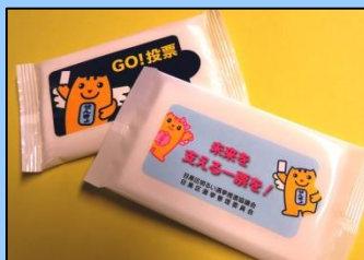
▲ ウェットティッシュ