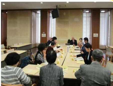
▲ 地区別の顔合わせ会