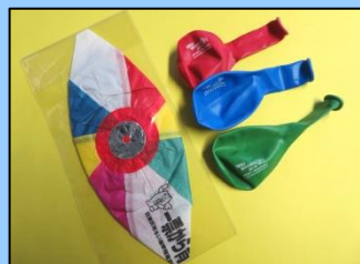
▲ 子どもに人気の紙風船と風船

○ 啓発品のご紹介 このような、明るい選挙の啓発グッズがあります。地域の行事や町会・自治会の会議などで啓発を行う際、ぜひご活用ください。