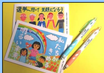
▲ メモ帳とボールペン