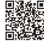
흙 부대 비치소

▶방재용 모래주머니는 구내 66개소에 배치되어 있으며 필요할 때는 자유로이 가져갈 수 있습니다. 흙 부대(모래주머니)설치 장소는 QR코드로 볼 수 있습니다. 상당수의 흙부대가 필요할 경우는 비바람이 강해지기 전에 도로 공원 서비스 사무소메구로 지역 서비스 담당계 (전화 3711-6825 일본어로만 대응). 히몬야 지역 서비스 담당계 (전화 5721-7287 일본어로만 대응) 에 상담해 주십시오.