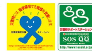
재해시 귀가 지원 스테이션