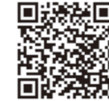
방재 기상정보 메일 등록 페이지

라디오 방송으로 재난 정보를 듣지 못한 경우, 전용 전화번호로 전화하면 재난 정보를 받을 수 있습니다. (라디오 방송 후 24시간 이내) 전용 전화번호 050-1807-3377