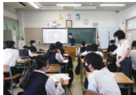
チーム・ティーチングの様子