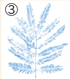
③ 小さい葉っぱがたくさん