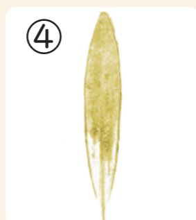
④ この木の葉からあぶらゆうめいしぼった油が有名