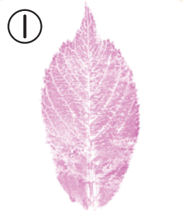
① 日本には200以上のしゅるいがある

いろいろな葉っぱを見て、違いが分かる「葉っぱ鑑定団」! 今回は特別に入団テストに挑戦だ! 葉っぱの跡は何の植物だ? 正しい名前を下から探して線でつなごう!