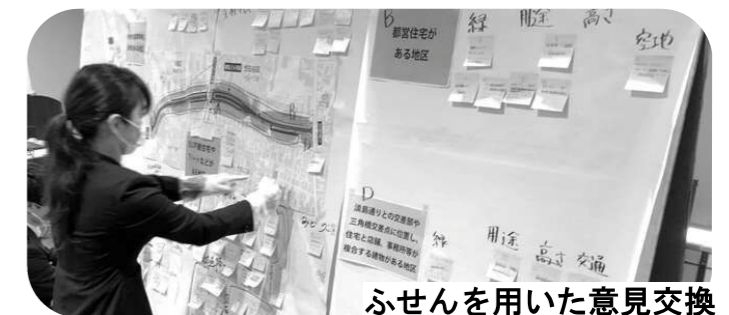
ふせんを用いた意見交換