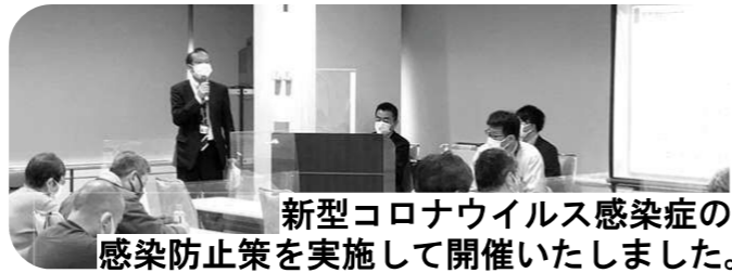
新型コロナウイルス感染症の感染防止策を実施して開催いたしました。

区から、土地利用の現況等より沿道地区を区分した4つの「地区」(右図A~Dに示す地区)をお示し、「建物の用途」「建物の高さ」「みどり」等の視点から、どのような建物が建つと良いか、どれくらいの高さになると良いかなど具体的な将来イメージについて、意見交換を行いました。