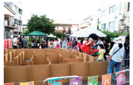
写真：夏休み子ども応援フェスティバルの様子（原町一丁目町会）

7月30日に子供縁日を予定しておりましたが、新型コロナウイルス感染症の拡大の影響から中止としました。9月17日に第九中学校で子ども縁日、18日に大神輿の引き回しを行い、子ども達が大変喜んでいました。