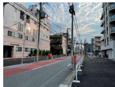
写真：令和3年度に整備された暫定歩道（原町 1-2-9 地先）

⇒また、工事着手前及び工事期間中の安全対策として、現在パイプ柵で囲っている事業用地を順次、暫定歩道として整備し開放していくと報告がありました。