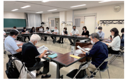
写真：協議会の様子

令和4年8月4日（木）に行われた第26回46沿道まちづくり協議会では、協議会が提出した「46沿道まちづくり提案」に関して、地域、東京都及び目黒区から提案に関する取組状況報告がありました。